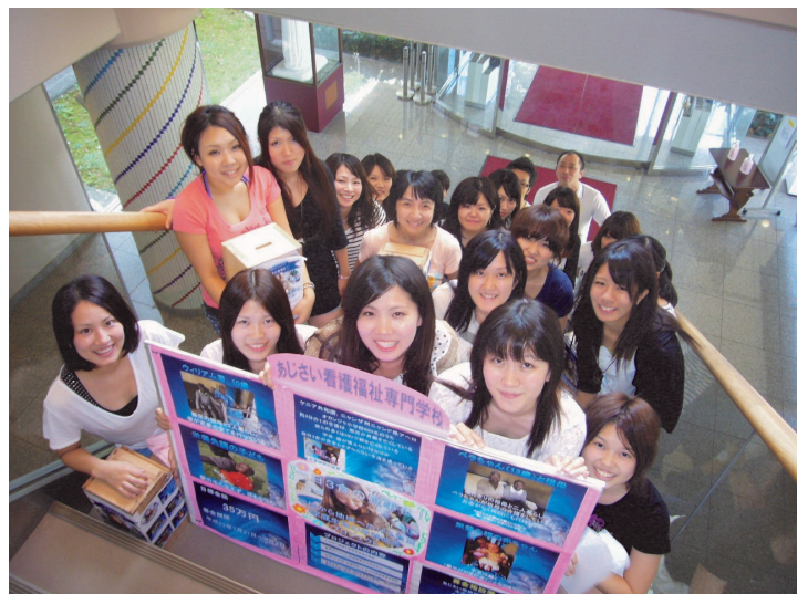
プロジェクトメンバー22名