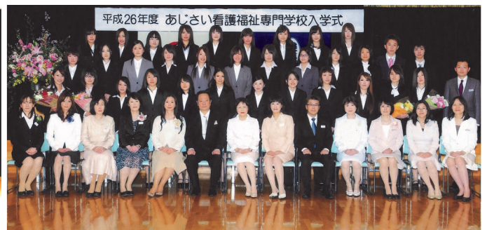
平成26年度 あじさい看護福祉専門学校 入学式 看護学科 2014年4月8日

桜花爛漫の4月8日(火)、平成26年度入学式を挙行し、看護学科33名、介護福祉学科14名の入学生を迎え、あじさい看護福祉専門学校の21年目が始まりました。