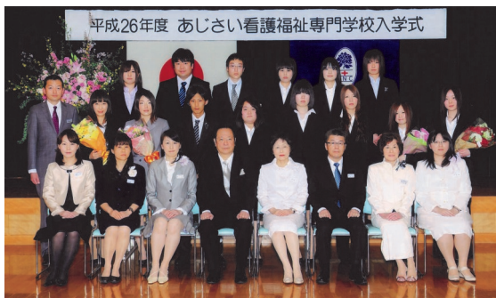
平成26年度 あじさい看護福祉専門学校 入学式 介護福祉学科 2014年4月8日